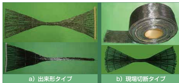
写真1. 工場製品CFアンカー

に、その品質を確保するための技術教育や調査研究を行うことが当研究会の主な目的です。現在は(財)日本建築防災協会の技術評価を取得した10社(鹿島建設、清水建設、大成建設、新日鉄エンジニアリング、コンステック、ショーボンド建設、東邦アーステック、東し、新日鉄マテリアルズ、三菱樹脂)により、理事会の運営を行っています。