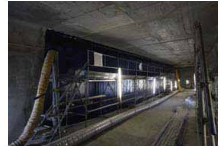
写真3. 浜名バイパス『浜名大橋』

当研究会では、CFアンカーとCFアンカーに用いるエポキシ樹脂に関して、厳しい評価基準を設けています。3社のメーカーから材料提供を受けていますが、炭素繊維シートとの接着試験とコンクリートからの引抜試験を行い、一定の基準に達