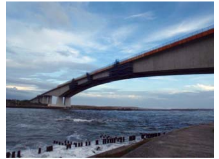
写真3. 浜名バイパス「浜名大橋」

て、厳しい評価基準を設けています。3社のメーカーから材料提供を受けていますが、炭素繊維シートとの接着試験とコンクリートからの引抜試験を行い、一定の基準に達したものを認定し