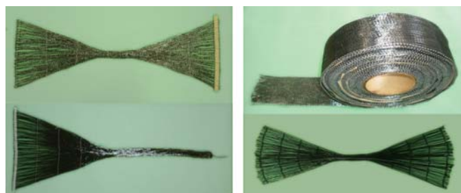
a) 出来形タイプ b) 現場切断タイプ

その後、当研究会独自の炭素繊維シートによる耐震補強法、「SR-CF工法」を開発。本工法の普及とともに、その品質を確保するための技術教育や調査研究を行うことが当研究会の主な目的です。現在は(一財)日本建築防災協会の技術評価を取得した10社(鹿島建設、清水建設、大成建設、新日鉄住金エンジニアリング、コンス